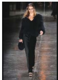
Peles, veludo e transparências - Animale.

Infelizmente nosso espaço aqui é pequeno, mas as apostas para o inverno de 2012 são muitas: mix de estampas, materiais metalizados, inspiração rústica, desenhos geométricos, crochês, couro... e por aí vai.