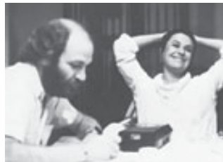
O colunista e a cantora na última entrevista, em 1981

quando alguém fala na morte de Carlos Gardel. "Ele não apenas não morreu, como canta cada vez mais", retrucam. O mesmo podemos dizer de Elis. Seus discos são a prova disso. Ouça-os. Ela continua cantando demais. Mas o que gravaria, se continuasse aqui? Apoiado em seus últimos discos e na disposição que manifestava, pedindo que lhe mandassem fitas, acredito que sem comprometer os provincianos mas como atenção de novidade, nos anos 80 ela se voltaria para os novos autores gaúchos. Sabia da força