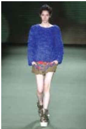
Tricôs de rafia de seda - Osklen.

Diversas marcas e estilistas desfilaram suas tendências e apostas já para o inverno desse ano. Vou mostrar para vocês algumas das minhas marcas favoritas e que confirmam as tendências para o inverno que falamos aqui na primeira matéria desse ano.