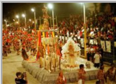
Caprichosos destacou Kleiton & Kledir