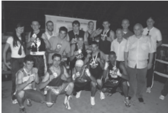
Atletas com vice e prefeito

A Copa Osoriense foi organizada pela Academia Boa Forma/Ong Catavento, Federação Riograndense de Pugilismo e Confederação Brasileira de Boxe, com o apoio da Prefeitura de Osório, através da Secretaria da Juventude, Esporte e Lazer e ainda dos médicos Primoir