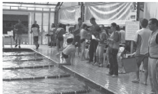
A transição na piscina é observada pelos árbitros

Haverá premiaçao para todos os participantes, com classificaçao geral e por catego-