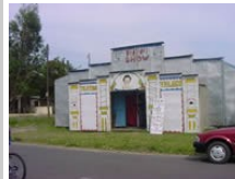
Telecto fica até o final do ano em Osório

"Estamos em um novo Portal e de cara nova. Queremos ser parceiros de todos os Internautas que nos "clícam". Foi por vocês que resolvemos mudar. Vocês, pessoas inteligentes que nos aceitam junto com estes loucos personagens que criamos. Só loucos como nós para criar o Amarante, o Perseu, o Persivâneo e agora a Patty Nirvana. Aceitamos a colaboração de todos. Somos abertos a novas ideias e o nosso objetivo é criarmos coisas novas no nosso litoral. Obrigado a todos que nos aceitam assim como somos. Um beijão para todo mundo."