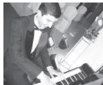
1º recital em 2007

O dia de hoje, é um marco de que parte da estrada para a realização de seu sonho já foi trilhada. Muito ainda há por fazer nesse árduo caminho, mas seu talento e competência o levarão mercadamente ao seu objetivo. “O justo sonho de um talentoso e jovem pianista que nasceu em Osório: Viajar pelo mundo, difundindo a sua arte, representando o seu país e especialmente a sua cidade.”