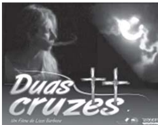
Filme "Duas Cruzes"

Baseado em suas pesquisas da Cultura Popular, Ivan Therra lançou o CD - Música da Praia , o primeiro registro dedicado exclusivamente aos ritmos e temas da região praieira do Rio Grande do Sul. O Proje-