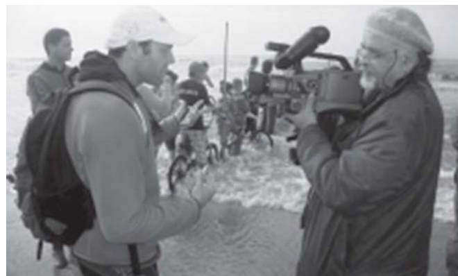
Filmes que retratam o cotidiano e a cultura litorânea são algumas de suas obras