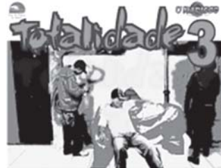
Filme "Totalidade 3"