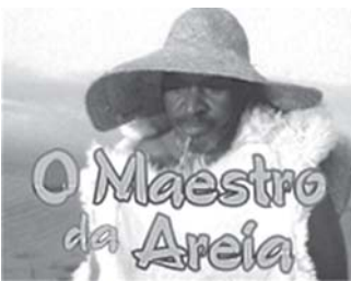
Filme "O Maestro da Areia"

O Maestro da Areia conta que das mãos do pescador nasciam instrumentos musicais, com os quais ele ensinava a gurizada da Praia a cantar e a tocar. O pescador atravessava as dunas para buscar, na Capororóca, a me-