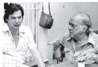
Tom Jobim com Vinícius de Moraes