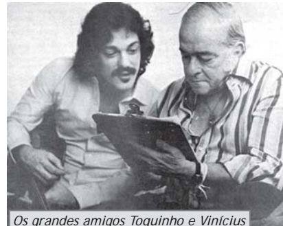
Os grandes amigos Toquinho e Vinícius